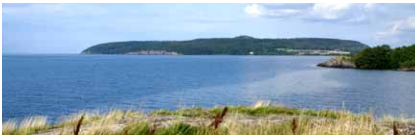
Omberg från naturreservatet Stora Lund

Omberg betyder Dimmornas berg. I sagor har det fått sitt namn av Drottning Omma. Omberg, östgötarnas heliga berg, är också känt som de blommande skogarnas berg.