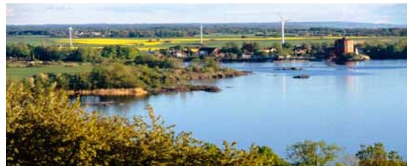
Utsikt från Hjässan på Omberg: Hästholmen, Vättern, Östgötaslätten ända ner mot Smålands skogar

Leden för dig till Västra väggarna med den branta förkastningsbranten högt över Vättern med vid horisont och utsikt till Västergötland. Därifrån kan du gå Östgötaleden direkt till Borghamn eller gå över berget till Mariadöttrarna i Heliga Hjärtas kloster . Där kan du delta i mässa eller tidebön och en stund i stillhet möta