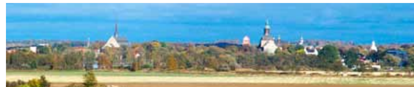
Vadstena från söder

Med heliga Birgitta och tusentals medvandrare närmar jag mig staden där Jungfru Marias frid råder, Pax Mariae. Tornen på Klosterkyrkorna, slottet och folkhögskolan – jag stan- nar upp och ser på dem, anar något av framkomstens, hemkomstens glädje.