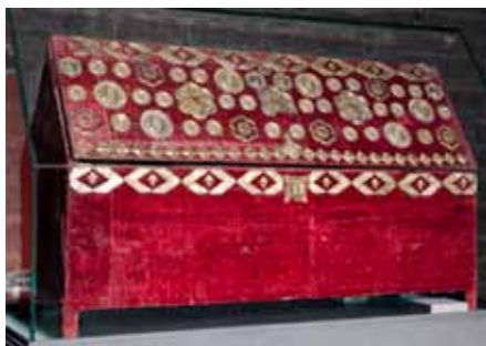
Den heliga Birgittas reliksskrin i Vadstena klosterkyrka

Från Borghamn eller Rogslösa går Klosterleden förbi Örberga kyrka där du kan välja en kortare väg mot Vad- stena över St. Ullevi eller gå hela leden förbi Nässja kyrka.