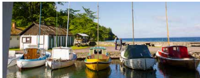
Hamnen i Borghamn

I Borghamn möts land och vatten på ett sätt som vi människor har nytta av. Hamnen är nu en fiske- och gästhamn. Sedan medeltiden har kalksten brutits nedanför Omberg vid Borghamn. Klosterkyrkan i Vadstena byggdes i slutet av 1300 talet och början av 1400 talet av kalksten därifrån. Nu finns i Borghamn ett vandrarhem.