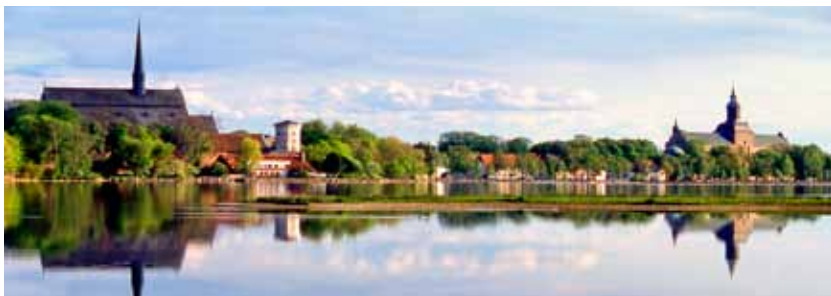
Vadstena från Vättern. Klosterkyrkan till vänster och Slottet till höger.

Vadstena kloster började byggas 1370 och kunde tas i bruk 1384. Då var Klosterkyrkan ännu inte påbörjad. Under hela tiden kyrkan byggdes firades mässa och tidegärd i ett litet träkapell byggt mellan pelarraderna. I klostret skulle det finnas 60 systrar och 13 prästmunkar samt 4 diakoner och 8 lekbröder. Antalet skulle motsvara de 13 apostlarna och de 72 lärjungarna. Vid reformationen stängdes Vadstena kloster definitivt 1595 när de sista systrarna fördrevs. Men kyrkan finns kvar med sina medeltida altartavlor och skulpturer.