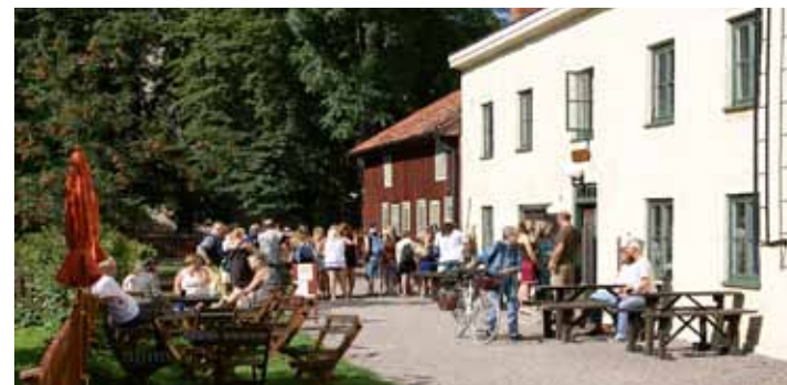
Pilgrimer utanför Pilgrimscentrum i Vadstena

Mer information finns på telefon +46(0)143-105 71 och på hemsidan www.pilgrimscentrum.se .