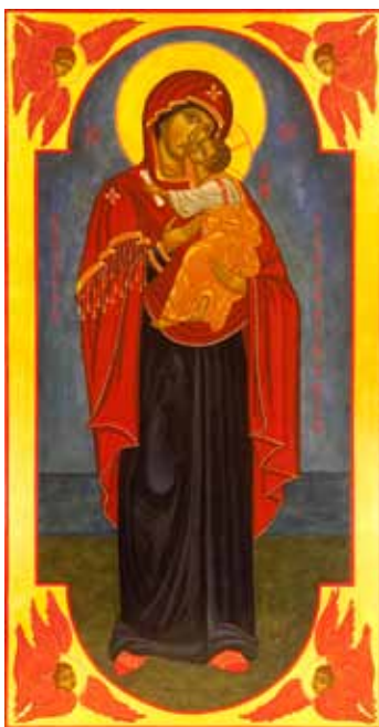
Gudsmodern Pilgrimernas vägviserska

Kära pilgrim! Må Herren välsigna dig! Må Herren visa dig vägen! Må Herren låta dig finna det du gett dig ut att söka! Må Herren leda dig fram till målet! I Faderns och Sonens och den Heliga Andens namn.