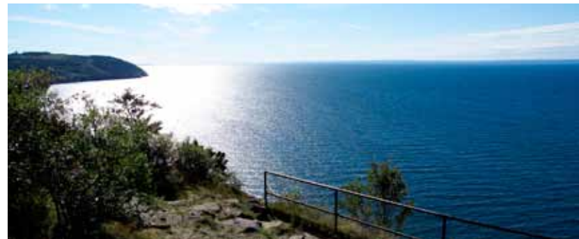
Västra Väggar på Omberg

Just nu, i detta eviga nu, är det jag som är här. Hjälp mig att se och förstå den uppgift du skapat mig för! Ge mig kraft och mod att vara din medskapare på det sätt du vill att jag ska vara!