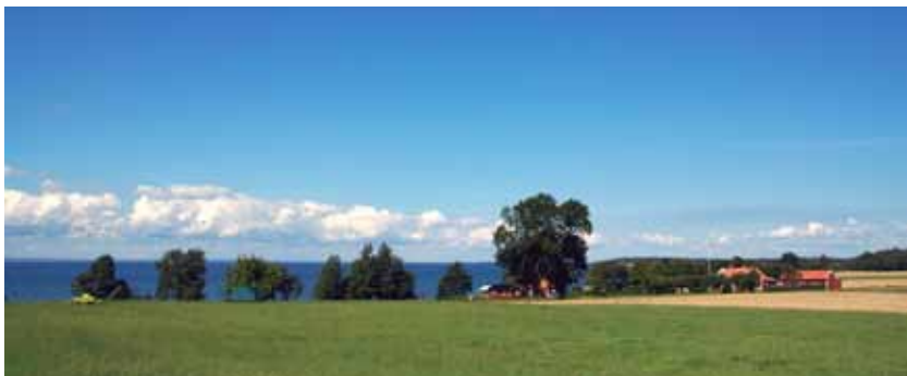
Himlen, Vättern och Östgötaslätten