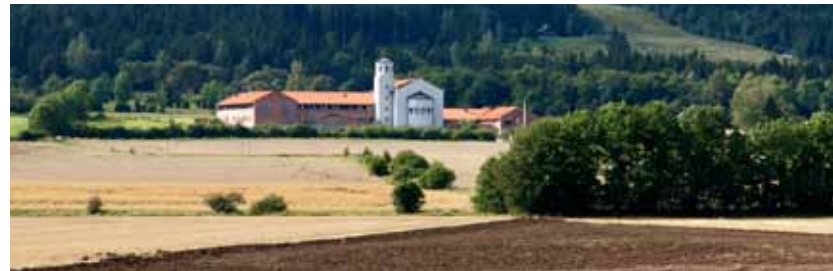
Heliga Hjärtas Kloster vid Omberg

Alvastra kloster anlades av franska cisterciensermunkar 1143. Det var det första av cisterciensernas kloster i Norden. Marken skänktes av den sverkerska kungaätten.