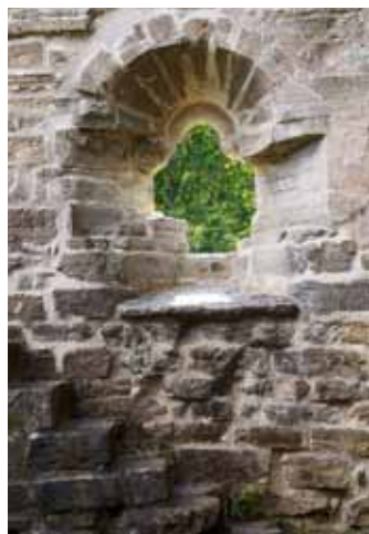
Trappa och fönster i Alvastra kloster

Omberg ligger i Östergötlands äldsta kulturbygd och har under lång tid utnyttjats som betesmark av traktens bönder. En tid under 1600- och 1700-talet var dock Omberg en kunglig jakt-park för hjortar, vilket begränsade böndernas betesrätt.