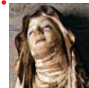
Den heliga Birgitta